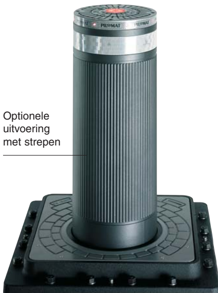
Optionele uitvoering met strepen