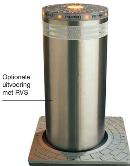
Optionele uitvoering met RVS